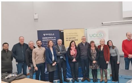
Réunion de lancement du laboratoire commun CATAMAREN le 17 décembre 2024 à l'Université de Lille (Villeneuve-d'Ascq).

Cliquez sur les visuels suivants pour les télécharger en haute définition :