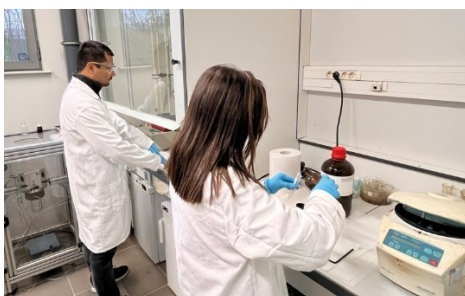
Chercheurs du laboratoire commun sur le campus de l'Université de Lille (Villeneuve-d'Ascq).